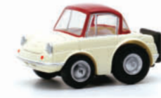
2020年にマツダ創立100周年を記念して作られたR360 COUPEのチョロQです。

ご応募・抽選について 右記の条件を全て満たした投稿を頂いた方が応募・抽選の対象となります。