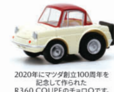
2020年にマツダ創立100周年を記念して作られたR360 COUPEのチョロQです。

ご応募・抽選について 右記の条件を全て満たした投稿を頂いた方が応募・抽選の対象となります。